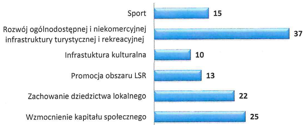
Wykres 2 Liczba fiszek projektowych złożonych przez potencjalnych beneficjentów z podziałem na zakres tematyczny w ramach pozostałych projektów (innych niż z zakresu przedsiębiorczości)