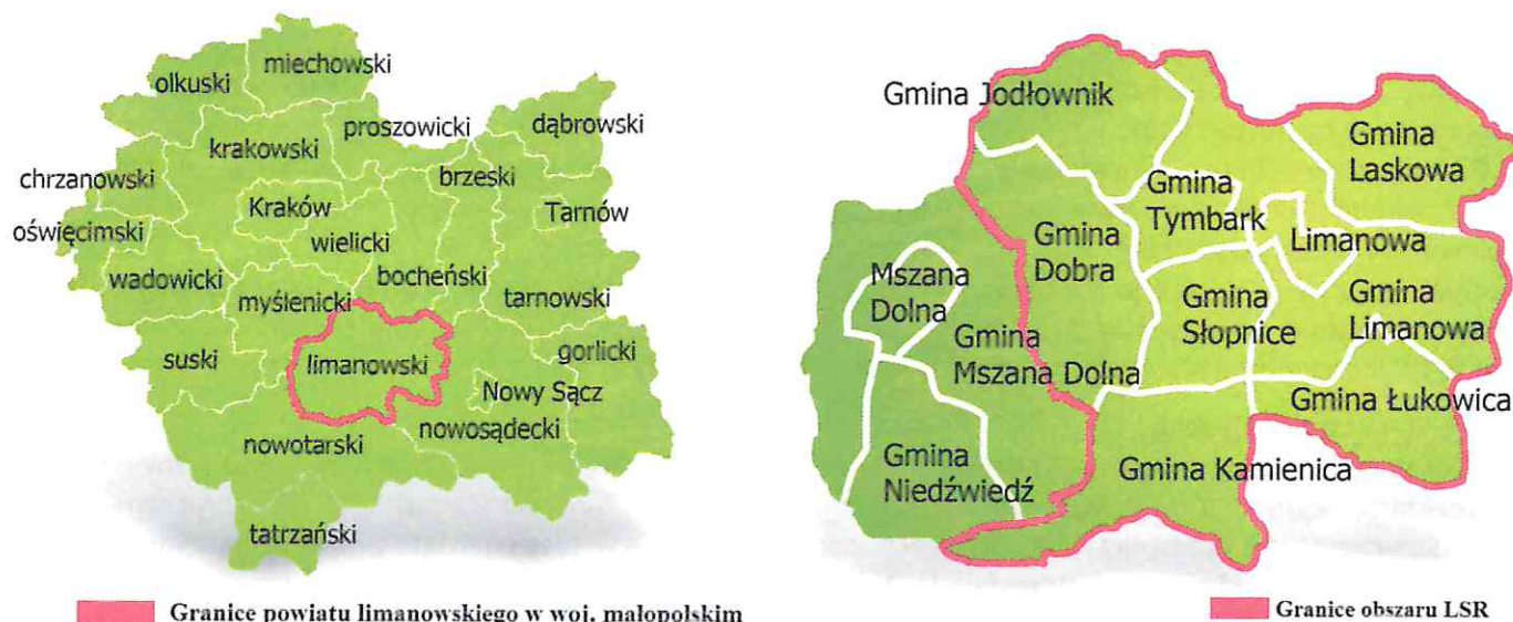
Rysunek 1 Mapy obszaru objętego LSR LGD „Przyjazna Ziemia Limanowska”