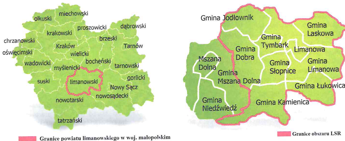
Rysunek 1 Mapy obszaru objętego LSR LGD „Przyjazna Ziemia Limanowska”