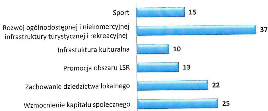
Wykres 2 Liczba fiszek projektowych złożonych przez potencjalnych beneficjentów z podziałem na zakres tematyczny w ramach pozostałych projektów (innych niż z zakresu przedsiębiorczości)